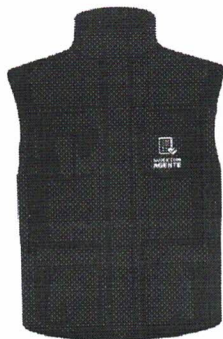
parte da frente