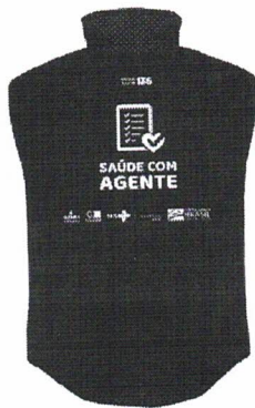
parte de trás