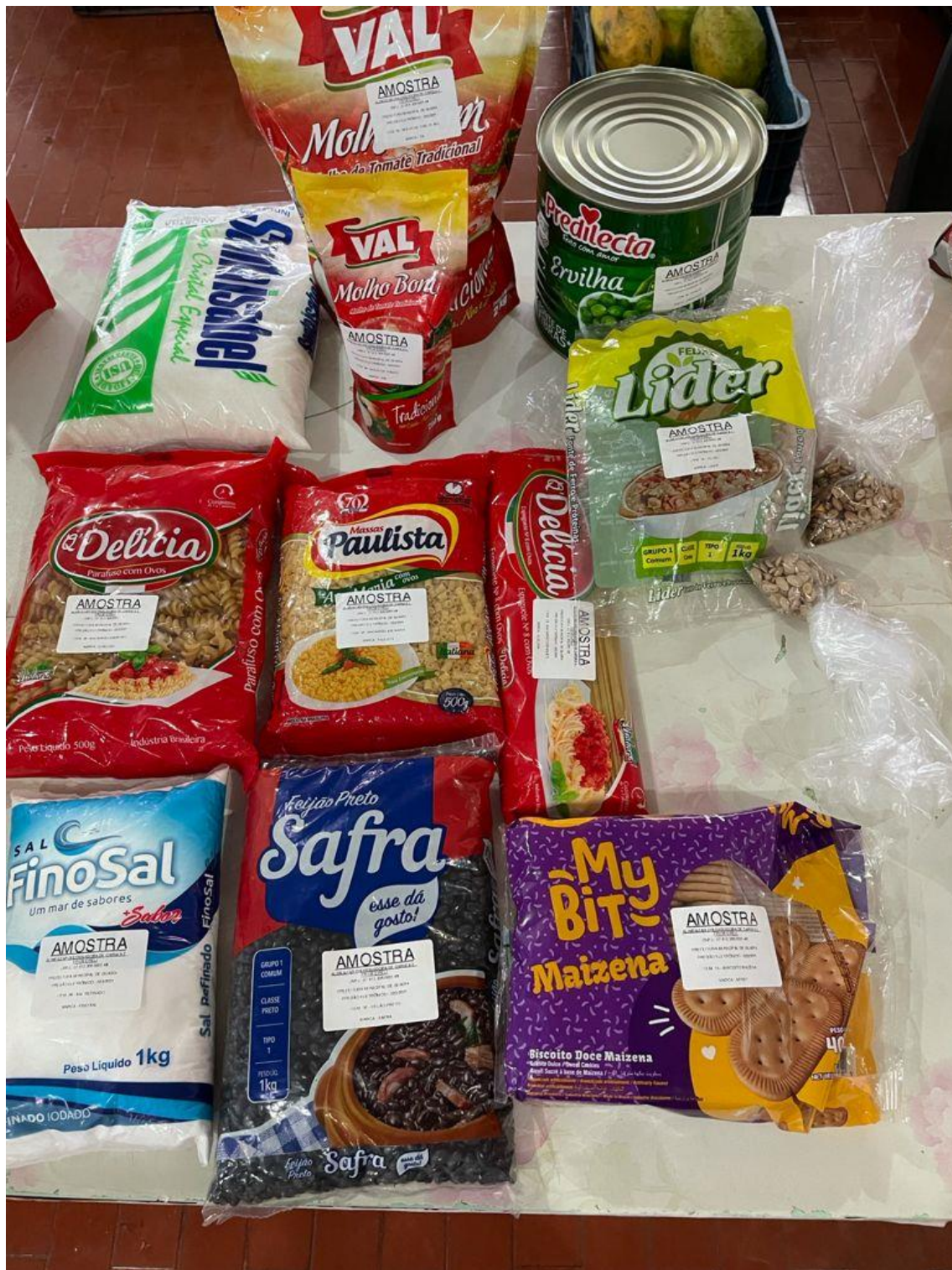
AMOSTRAS APRESENTADAS PELA EMPRESA: ALIMENTAR DISTRIBUIDORA DE CARNES E FRIOS EIRELI