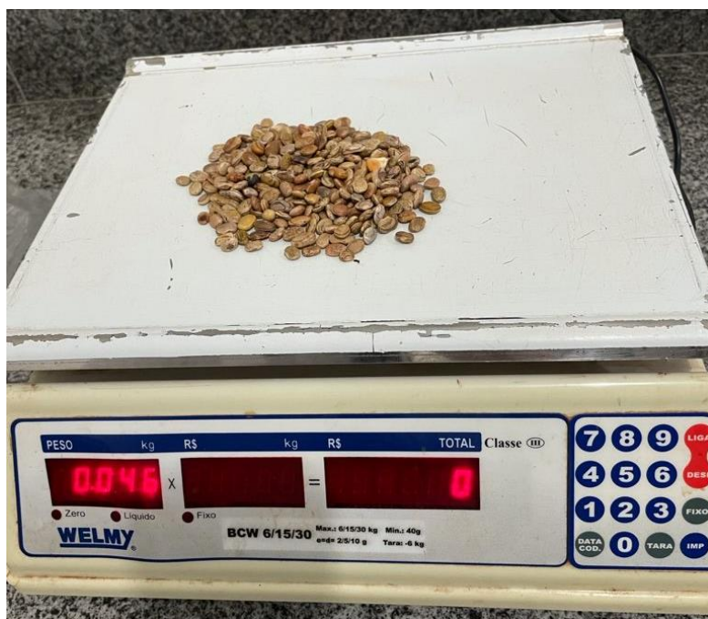
SUJISCIDADES DA AMOSTRA DO ITEM 34 - FEIJÃO