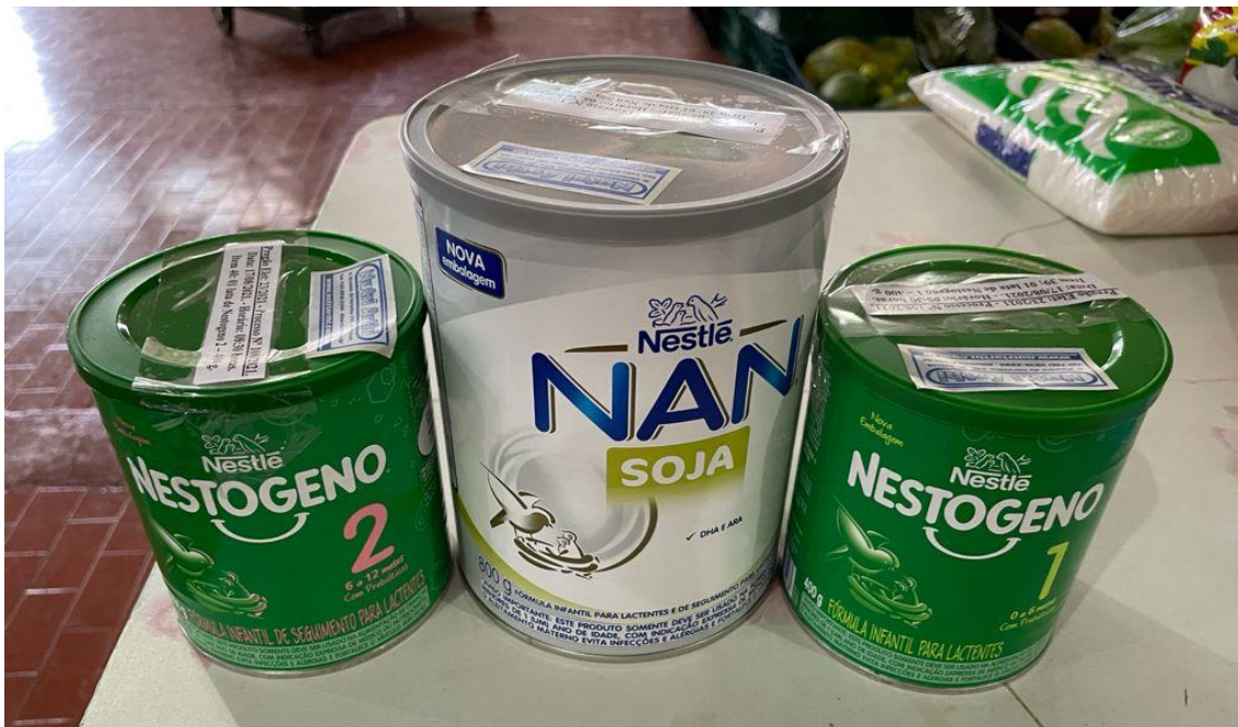
AMOSTRAS APRESENTADAS PELA EMPRESA: NUTRI ARTHI COMERCIAL LTDA – ME