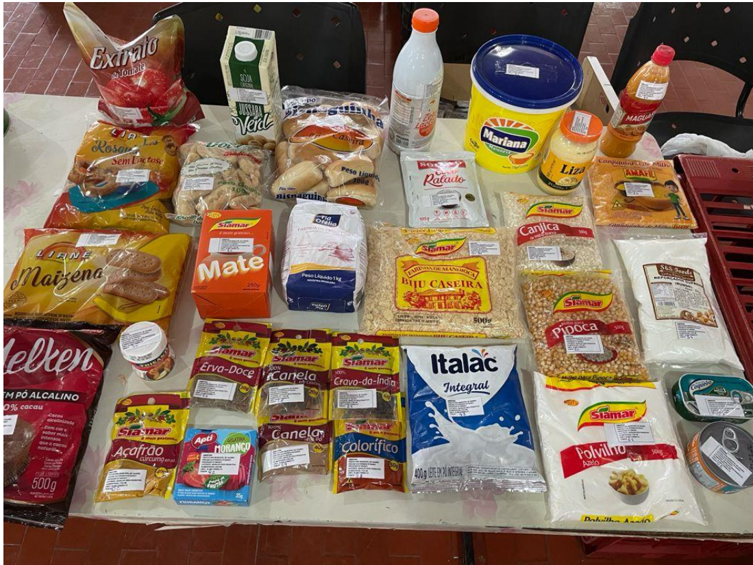
AMOSTRAS APRESENTADAS PELA EMPRESA: GERALDO & REIS PRODUTOS ALIMENTICIOS