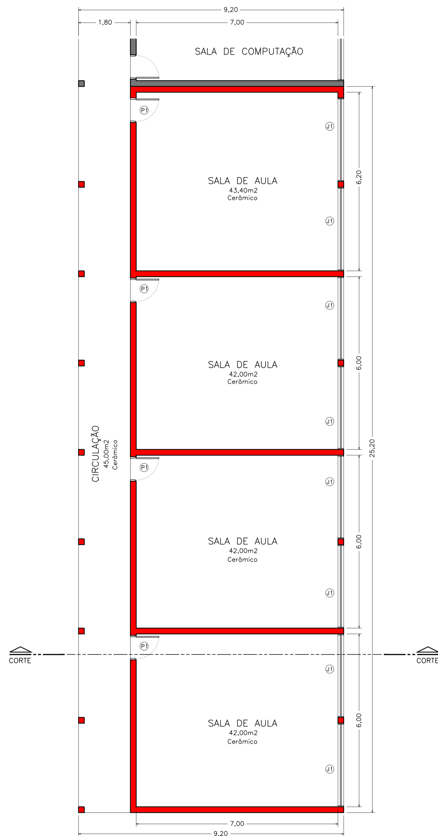
Planta Baixa Escala - 1/75