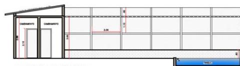
2 CORTE LONGITUDINAL ESCALA 1:100