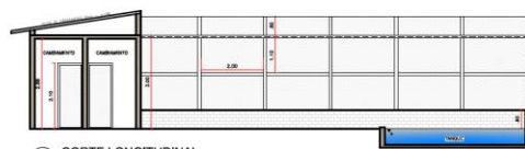
2 CORTE LONGITUDINAL ESCALA 1:100