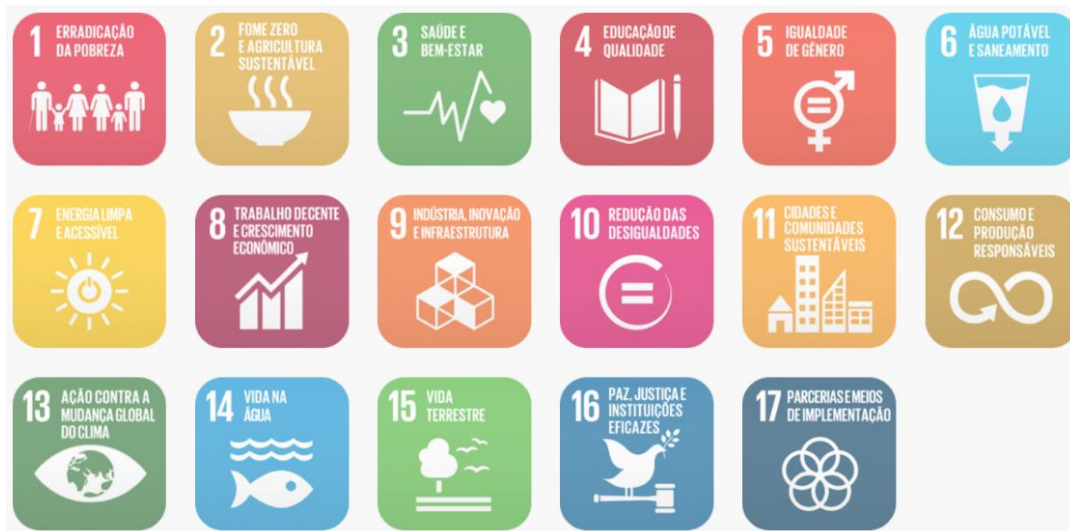
Figura 02: Objetivos de Desenvolvimento Sustentável