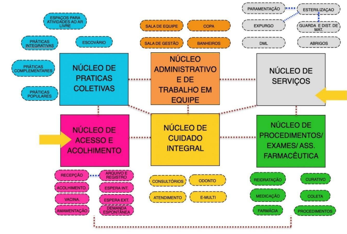
Figura 1: Diagrama de Massas