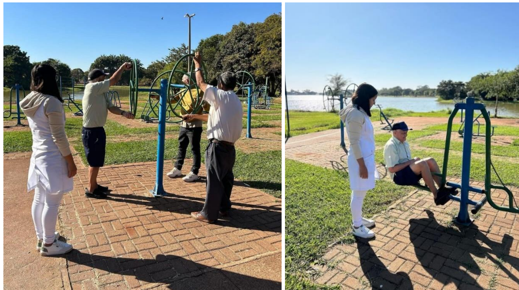
Circuito funcional em ambiente externo

Objetivo da atividade: Fomentar as funcionalidades do corpo humano.