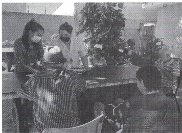
Nutrição - Atividade para orientação e elaboração de cardápio nutricional, conforme hábitos alimentares das pessoas idosas atendidas