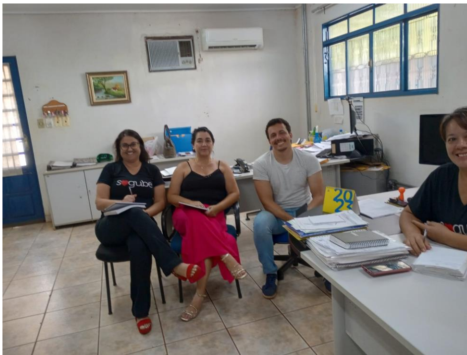
Visita da Comissão.