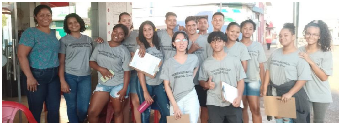
Turma 3 Curso Operador de loja e mercado