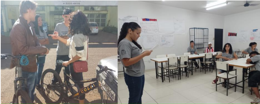
Turma 1 Curso Auxiliar de Almojarifado