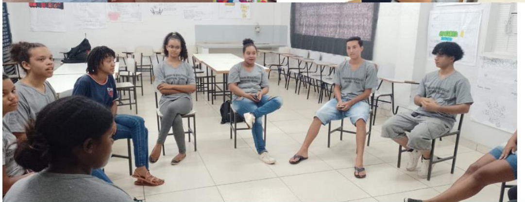
Turma 3 Curso Operador de loja e mercado