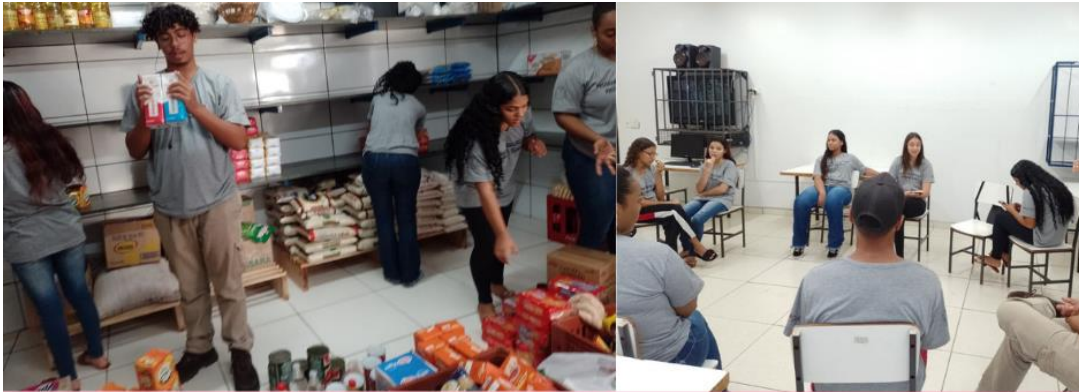
Turma 3 Curso Operador de loja e mercado