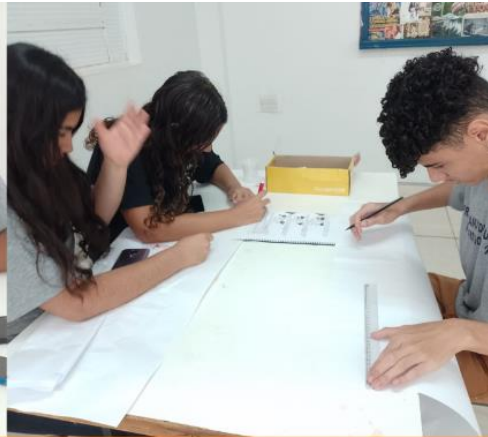
Turma 2 Curso Técnicas de Vendas