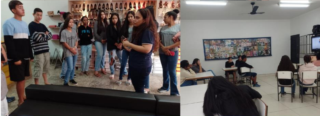
Turma 1 Curso Auxiliar de Almojarifado