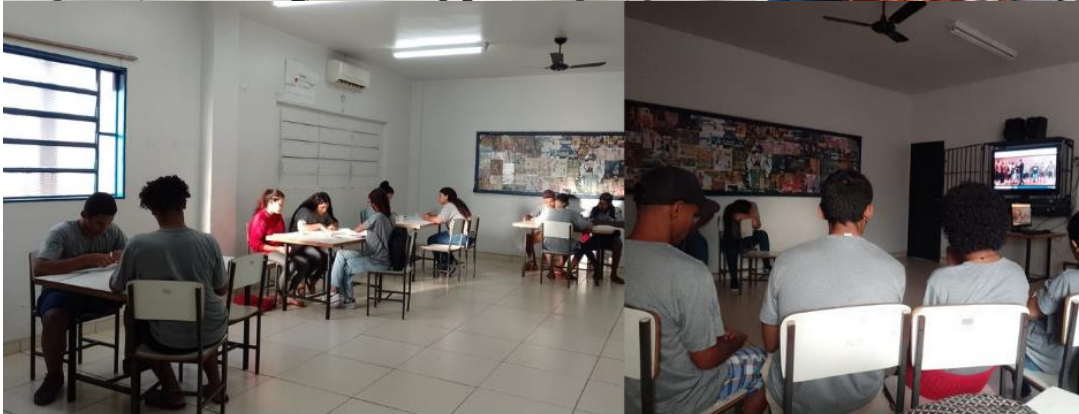
Turma 3 Curso Operador de loja e mercado