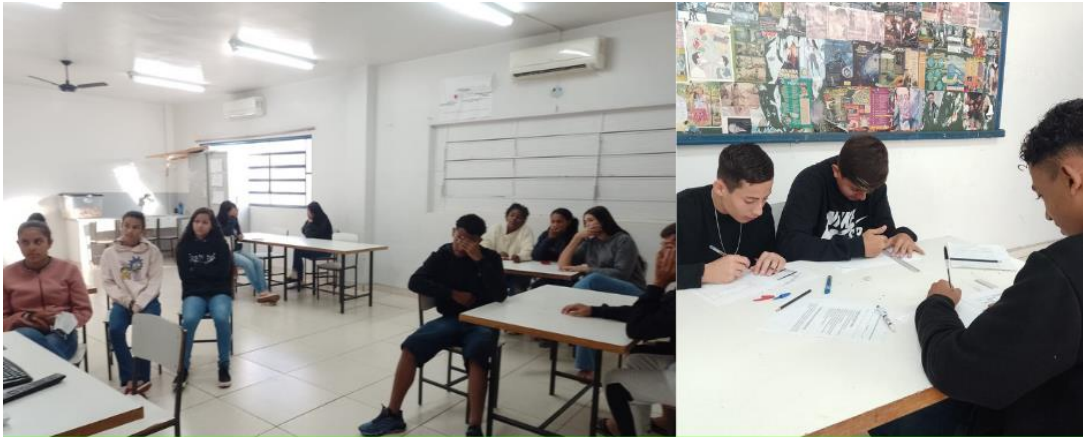
Turma 1 Curso Auxiliar de Almojarifado