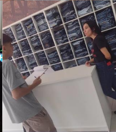
Turma 2 Curso Técnicas de Vendas