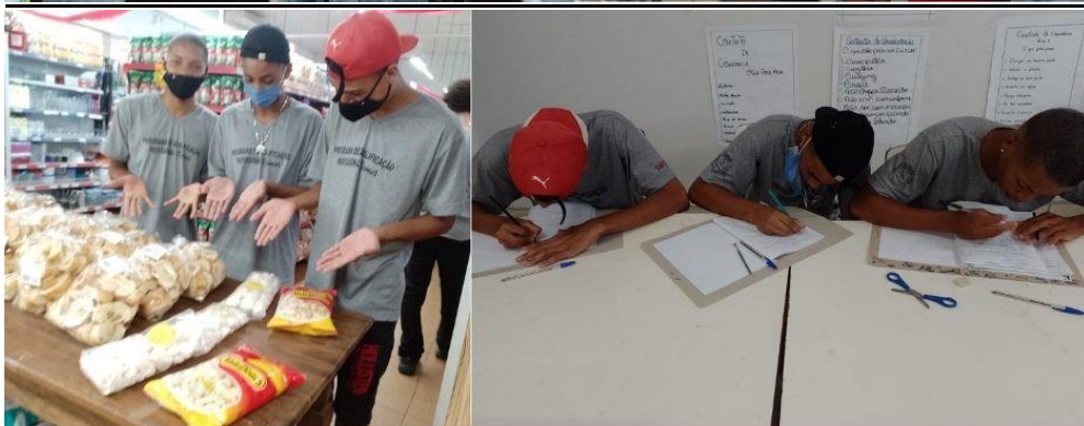
Turma 3 Curso Operador de loja e mercado