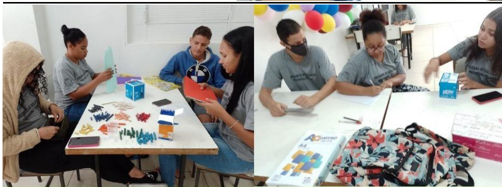
Turma 1 Curso Auxiliar de Almojarifado