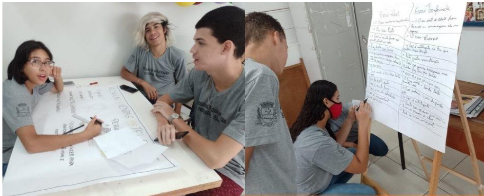
Turma 2 Curso Técnicas de Vendas