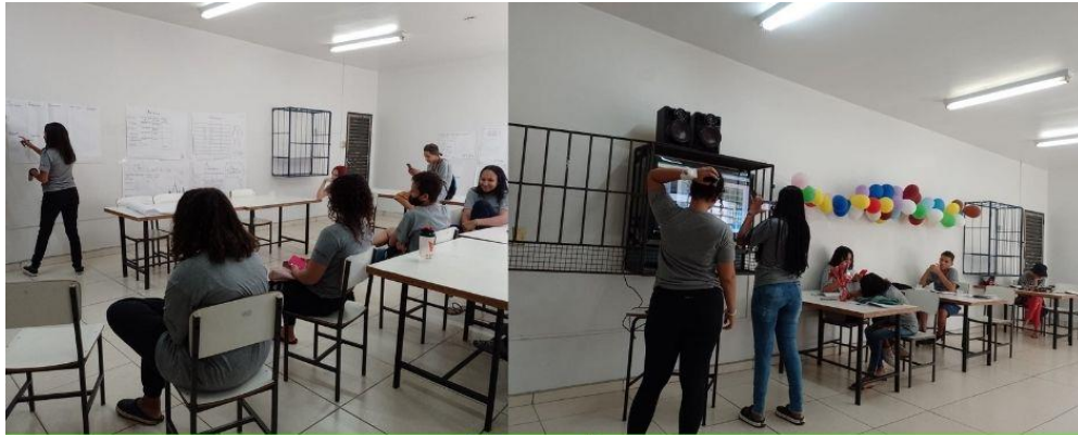
Turma 1 Curso Auxiliar de Almojarifado