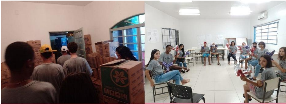
Turma 3 Curso Operador de loja e mercado