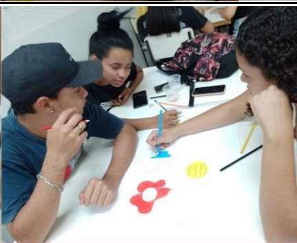
Turma 3 Curso Operador de loja e mercado