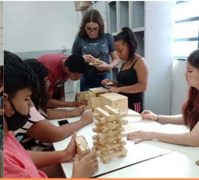
Turma 2 Curso Técnicas de Vendas