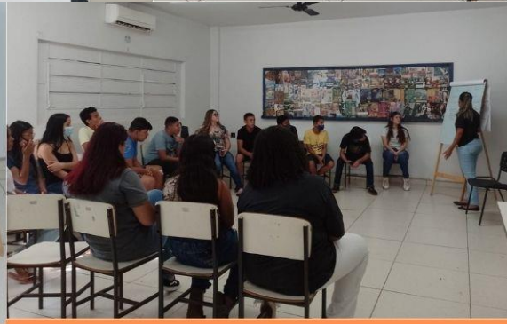
Turma 2 Curso Técnicas de Vendas