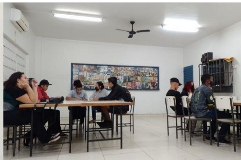
Turma 1 Curso Auxiliar de Almojarifado