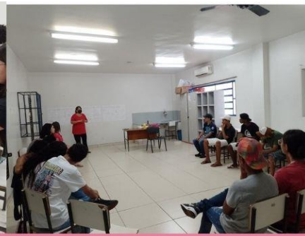
Turma 3 Curso Operador de loja e mercado