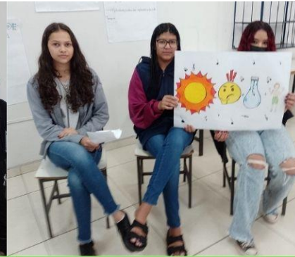
Turma 1 Curso Auxiliar de Almojarifado