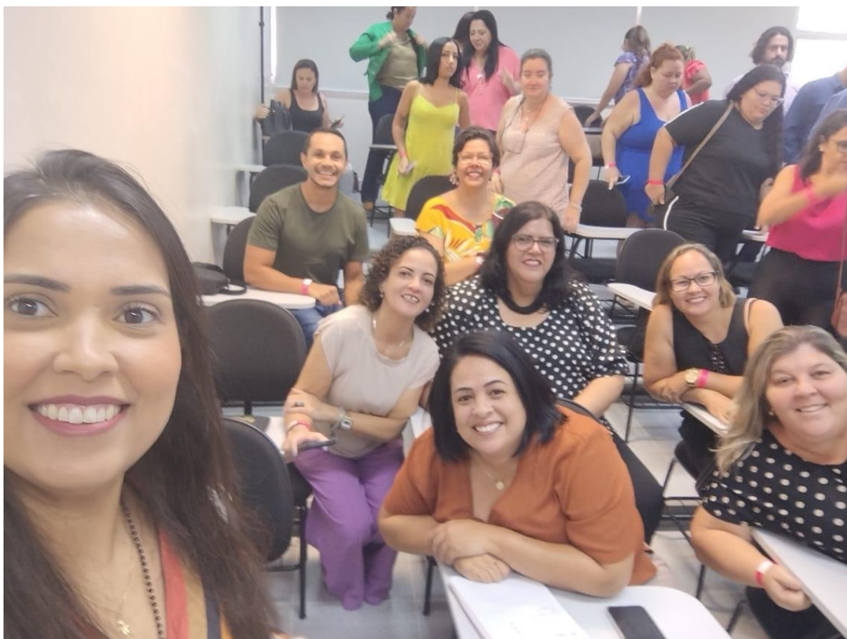
1º Fórum Regional de Discussões sobre Assistência Integral às Mulheres Vítimas de Violência